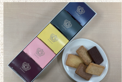
Cadeau Pâtisserie 丸の内 東京都千代田区丸の内 1-4-1 永楽ビル 1F オンラインショップもあります。 https://www.cadeau-style.jp/