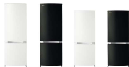
GR-M17BS (W)シェルホワイト (K) ピュアブラック GR-M15BS (W)シェルホワイト (K) ピュアブラック