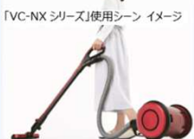
「VC-NXシリーズ」使用シーンイメージ

ふとん用ブラシや丸ブラシなど様々な場所のお掃除が可能な付属品を同梱。さらに、家具の下やすき間など、照明が届かない所のゴミも見やすいLEDライト付きの「ワイドピカッとブラシ」を搭載。暗くて見えにくいところまで丁寧に掃除ができます。