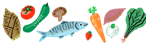
※キューサイ株式会社 「予防医療に関する意識調査」2018年8月 N600

東芝では、このたび期間限定で、バランスの良い食事づくりにお役立ちのオープンレンジ「石窯ドーム」を使った料理レッスンイベントを開催いたします。ぜひ、この機会にイベントのご案内やご参加、石窯ドームのご拡販をよろしくお願い申し上げます。