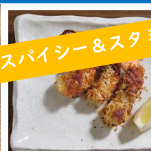
カレー味のエビフライ