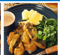
タンドリー風 鱈のスパイシー焼き