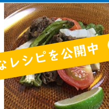
牛肉とトマトのメキシカン スパイシーグリル