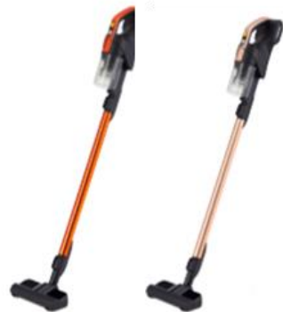
VC-CLS1 (D)グランオレンジ (N)ピンクブロス