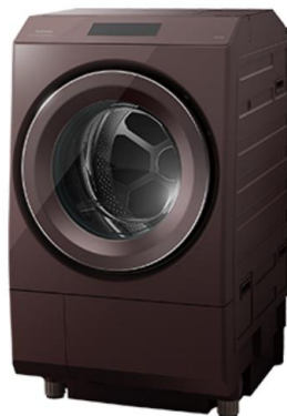
(T) ボルドーブラウン